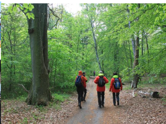
I den grönskande skogens sal.