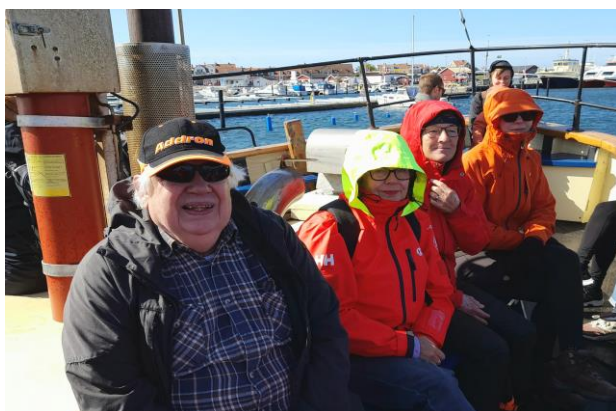
Glatt sällskap på gungan den blå.